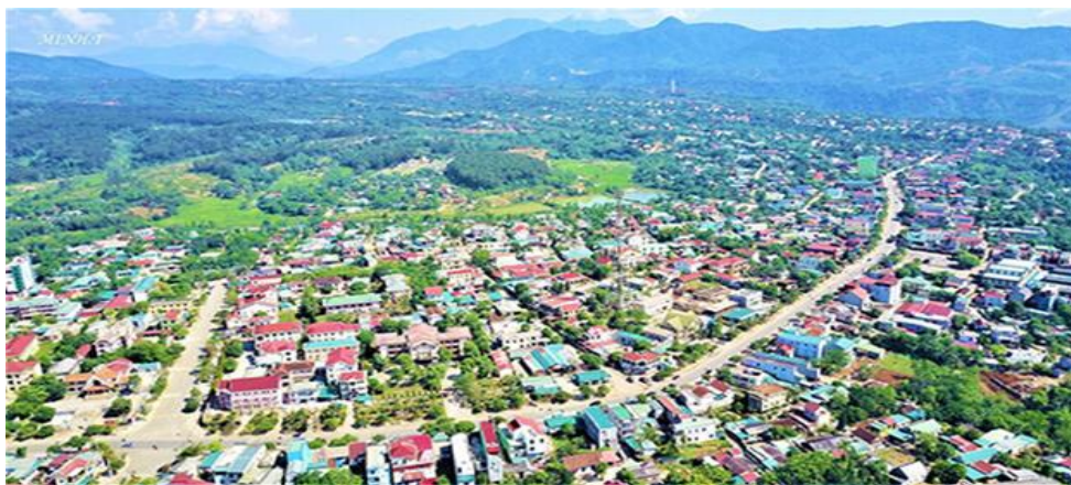
Thị trấn Khe Sanh.

Một trong những điểm sáng trong quá trình phát triển là việc xây dựng cơ sở hạ tầng và phát triển kinh tế. Từ những ngày đầu khó khăn, các địa phương đã khôi phục lại sản xuất nông nghiệp, đẩy mạnh chăn nuôi, trồng trọt. “ Đất lành thành quả ngọt ” - các mô hình kinh tế mới, phù hợp với đặc thù của vùng đất miền núi đã được áp dụng, như kinh tế trang trại, gia trại, kinh tế hộ, VAC (vườn, ao, chuồng), hình thành các vùng chuyên canh, sản phẩm hàng hoá giá trị cao, như cây cà phê, cây ăn quả, chuối, sắn, ngô, khoai, rau màu..., khai thác tiềm năng du lịch sinh thái, phát triển dịch vụ, thương mại, công nghiệp, tiểu thủ công nghiệp và năng lượng tái tạo. Các chương trình phát triển giao thông, điện, nước sinh hoạt, y tế, giáo dục cũng được triển khai đồng bộ, tạo điều kiện thuận lợi cho người dân phát triển kinh tế, tạo nguồn lực lao động chất lượng cao, xây dựng con người mới xã hội chủ nghĩa.